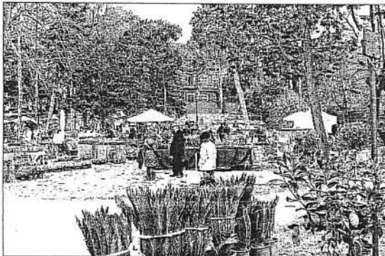
Con Giardini D'Autore inizia il lavoro del nuovo ufficio stampa

RICCIONE - Essere presenti su testate nazionali ed internazionali per promuovere la propria immagine è una scelta strategica che il sindaco Massimo Pironi ha voluto nel suo programma amministrativo. L'incarico sarà affidato all'agenzia Omnia Relations di Bologna che per un anno, con l'opzione di rinnovo dell'incarico, seguirà l'attività di ufficio stampa e strategie di comunicazione nazionali e internazionali del Comune di Riccione con un compenso annuo di 80mila euro. L'agenzia incaricata dovrà fungere, cioè, da tramite tra l'azienda Riccione e i professionisti dei media. Turismo, moda, arte, cinema e wellness alcune delle aree di intervento del gruppo bolognese. Fra i suoi clienti ci sono località e marche come Cortina Turismo, Louis Vuitton e la Fondazione Fellini. Due anni fa tale incarico era stato affidato all'agenzia Report Porter Novelli di Milano che ha collaborato per qualche anno con l'assessorato al Turismo di Riccione e con la Palariccione