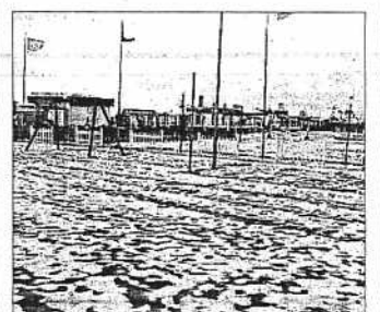
Neve in spiaggia, poche settimane fa