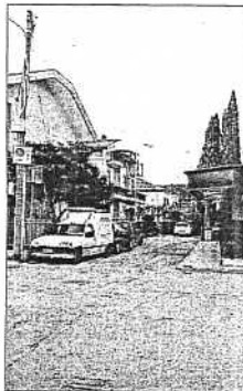
Da via Serra non c'è uscita

Andando con ordine, a novembre un gruppo di residenti fra viale Ruffini e viale Serra (questa è senza uscita) hanno inviato una lettera, con una quarantina di firme, al sindaco Massimo Pironi chiedendo di poter entrare e uscire dalle loro abitazioni quando c'è il mercato lasciando libero passaggio sul lato Rimini di viale Ruffini (che corre a fianco di piazza Unità, cuore del mercato). Minacciando, in caso avvenga qualche fatto grave, di richie-