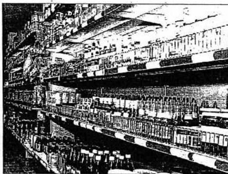
Agente di commercio arrotonda con soldi e merce

per clienti. Visita quelli "vecchi" e ne fa anche dei nuovi. Ogni giorno torna in ditta e consegna gli ordini. Dal magazzino dell'ingrosso parte il camion e consegna la merce. Fin qui tutto regolare, se non fosse che per alcuni clienti il rappresentante, nel giro successivo, incassa la fattura, la quietanza e poi si mette i soldi in tasca. Tutte somme piccole, per la verità, sull'ordine di 100/200 euro l'una che, non risultando saldante non impensieriscono più di tanto l'ufficio contabilità. Ufficio che, a metà ottobre e a stagione finita, si accorge che molte fatture non risultano pagate e telefona ai clienti. I commercianti cadono dalle nuvole e, fatture quietanzate in mano, dimostrano che loro quei soldi li hanno pagati da mesi. Scatta così un controllo interno e