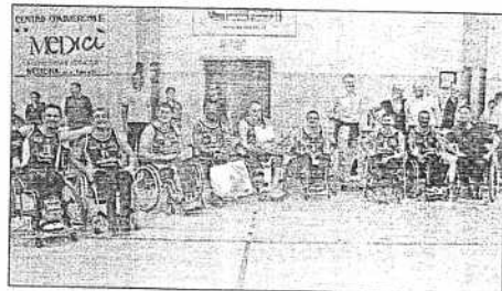
Una delle squadre che prenderà parte al torneo