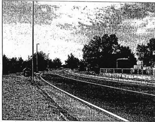
Via Gradara Liscia è ampia come una pista, e piena di pericoli

La strada è larga, passano i mezzi pesanti e e ci sono incroci dove si va spesso a sbattere