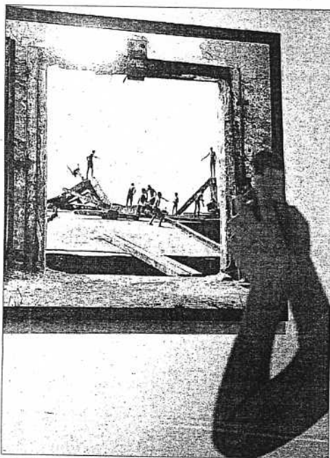
Il Premio giornalistico Ilaria Alpi è un fiore all'occhiello della città, ma l'organizzazione dell'ospitalità poteva essere migliore

RICCIONE - Si è conclusa ieri sera l'edizione 2010 del Premio giornalistico televisivo Ilaria Alpi. Fiore all'occhiello della città di Riccione, ha visto alternarsi, nelle varie situazioni di cui era costituito, politici, giornalisti, scrittori e magistrati. Ogni sera, spente le luci del palazzo dei congressi (o del palazzo del turismo) il ritrovo per tutti era Villa Mussolini, dove il comico e giornalista Diego Bianchi, noto per il suo blog Tolleranza Zoro e per la partecipazione alla trasmissione televisiva di Serena Dandini "Parla con me", intratteneva a suon di battute, musica e commenti sulla giornata i presenti. In apertura, prima dell'analisi dei fatti del giorno, Bianchi passava in rassegna fra i presenti alla ricerca dei free lance finalisti, se ne trovava qualcuno la domanda successiva era relativa all'alloggio. Curioso? Non tanto, anzi. Perché pare che gli organizzatori del premio abbiano avuto qualche difficoltà quest'anno nella gestione dell'ospitalità dei giovani giornalisti che hanno avuto il merito di aggiudicarsi la finale. A qualcuno, si mormora, è stata offerta una sola notte in qualche hotel, ad altri tutte e tre le notti pagate in uno degli alberghi più belli della città. A stabilire il peso e la misura pare sia stata la classificazione finale. Quindi ai vincitori delle varie categorie, oltre al premio in denaro è andata l'ospitalità a cinque stelle, agli altri una notte a scelta e a sorpresa... perché a