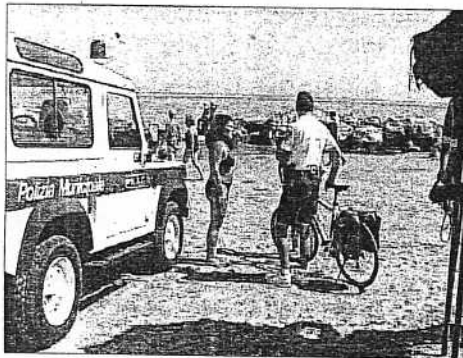
Mattino: i vigili del Nac tengono pulita la spiaggia

MISANO - Magari non si sono ancora accordati sull'orario in cui "affrontarsi" sulla spiaggia di Mirano, ma certo è che in questi primi giorni di interventi del gruppo Nac (Nucleo antiabusivismo commerciale) dei vigili di Riccione e Misano, gli abusivi hanno atteso che i primi finissero il loro turno di lavoro per iniziare il loro. Infatti ieri mattina i vigili urbani sono scesi in forze, coadiuvati da un paio di militari della capitaneria di porto, nella zona più calda di Misano, sulla battigia all'altezza della zona n. 3, proprio al confine con Riccione. Una presenza che ha ripulito la spiaggia dai tanti abusivi e vu' cumprà i quali, dall'inizio dell'estate, allestiscono il loro mercatino ambulante abusivo ritagliandosi - con delle sdraio posizionate in verticale - uno spazio tra