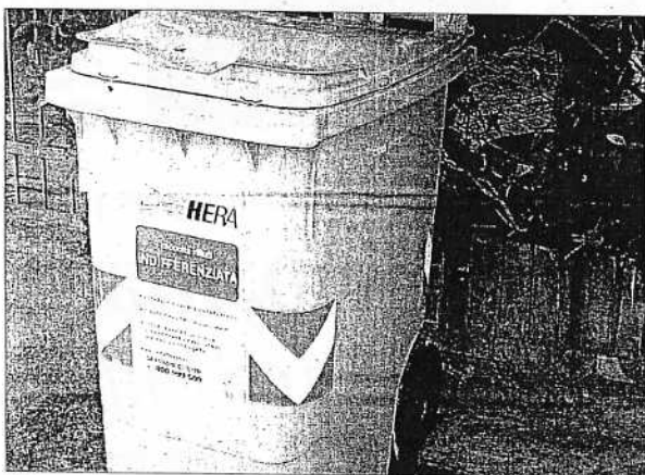
E' tornato il caro, vecchio (anche se piccolo) bidone dell'indifferenziato old style

RICCIONE - Chissà se si è trattato di un momento di debolezza, di un'allucinazione dovuta al caldo (?) del Ferragosto in arrivo o di un vero e proprio "contrordine spazzini!" imposto dai vertici della nota società di servizi Hera. Perché dopo mesi di ferrate campagne di sensibilizzazione sull'arrivo del cassonetto elettronico E-Gate, di consegne a domicilio di chiavette e buste per la raccolta differenziata dei rifiuti, spot, riunioni, comunicati e chi più ne ha più ne metta, nel cuore della notte, in una zona della città già da inizio estate "e-gateizzata" sono spuntati due anomali bidoni per l'indifferenziato che possiamo definire vintage, vecchio stile e senza chiavetta-apricollotta come invece è l'E-Gate. "Accipicchia e ora che succede?", si sono chiesti gli attoniti abitanti della zona, quando con micro sacchetto in una mano e chiavetta nell'altra hanno scoperto le new entry silenziosa-