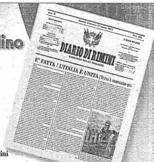
Iniziativa valida solo per la Provincia di Rimini